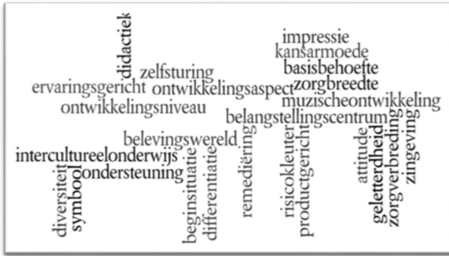
Figuur 1: Wordwolk van kernbegrippen voor de Bachelor Kleuteronderwijs.

Om docenten uit de betrokken lerarenopleidingen te ondersteunen bij het implementatieproces van WTL rond kernbegrippen, werd gekozen voor een wiki als drager van dit kernbegrippenapparaat. Voor elk van de 100 kernbegrippen is een aparte pagina aangemaakt, waarop minimaal een definitie en illustratiemateriaal uit studiemateriaal voor studenten te vinden is. De docent-gebruiker vindt er verder ook links naar verwante begrippen en vindt er af en toe een extra afbeelding of verduidelijkende figuur. Om ervoor te zorgen dat de opgenomen definities voor kernbegrippen gedragen zijn, werd elke pagina aangemaakt door een bepaalde Bacheloropleiding Kleuteronderwijs en gefeedbackt door een andere. De ambiguïteit en het gebrek aan (eenduidige) definities waarover studenten rapporteerden (zie ook hoger), bleek echter ook merkbaar in het voorhanden zijnde materiaal uit de verschillende docententeams. De wiki draagt dan ook bij aan een uniformer kernbegrippenapparaat binnen een docententeam, maar ook over teams heen.