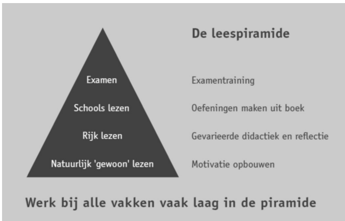
Figuur 1 – De leespiramide.

Het denken over lezen wordt zichtbaar in de leespiramide. Daarin zitten de activiteiten die de leraar onderneemt om zijn leerlingen tot een betere lezer op te leiden én om hen een goed examen te laten maken. De leespiramide maakt duidelijk hoe leesvaardigheid wordt opgebouwd.