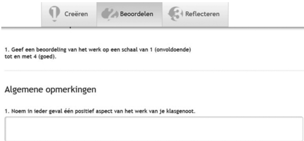
Figuur 3 – Screenshot uit PeerScholar .

Ook kan de inzet van technische systemen, zoals PeerScholar , hierin een uitkomst zijn.