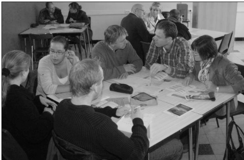
Afbeelding 1 – Het schoolteam wisselt info uit over ‘leren leren’.