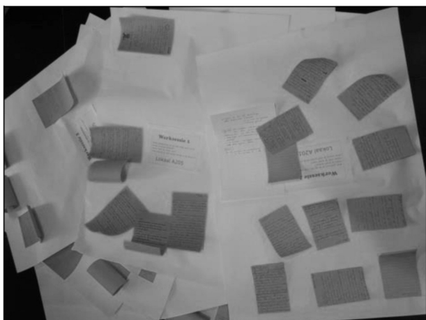
Afbeelding 2 & 3 – De opgehaalde informatie rond ‘leren leren’ wordt genoteerd op post-its en verzameld op grote vellen.

In een tweede fase gaat een coördinerend team VOET/GOK verder aan de slag. Dat team, bestaande uit een tiental leerkrachten, heeft het mandaat gekregen om betreffende de problematiek rond ‘leren leren’ acties te ontwikkelen. De coördinatieploeg is representatief voor het voltallige lerarenkorps en vertegenwoordigt uiteenlopende vak-