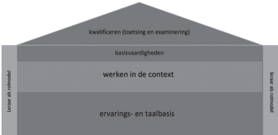
Figuur 2 – Model ‘Nederlands, rekenen, Engels en burgerschap in de mbo-context’.

Voor de programmaliijn ‘fo’ staan de volgende punten centraal: