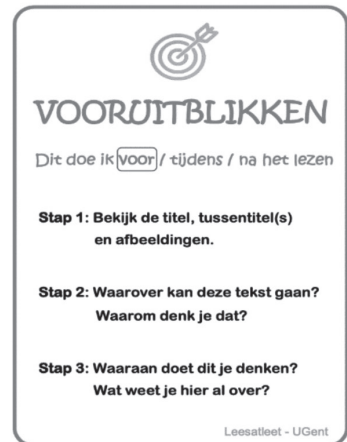
Figuur 4 – Strategiekaart Iedereen Leesatleet .