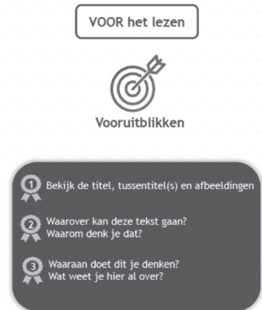
Figuur 3 – Strategiekaart ProjectExpert .