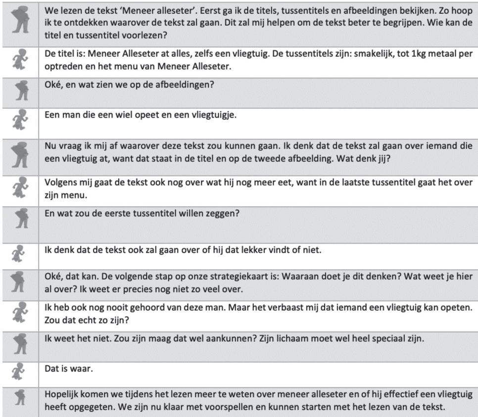
Figuur 5 – Voorbeeld modelleren strategie 'voorblikken'.

Stap 3 – Bij deze stap demonstreert de leraar zelf hardop hoe je de strategie toepast. Dat kan als volgt: