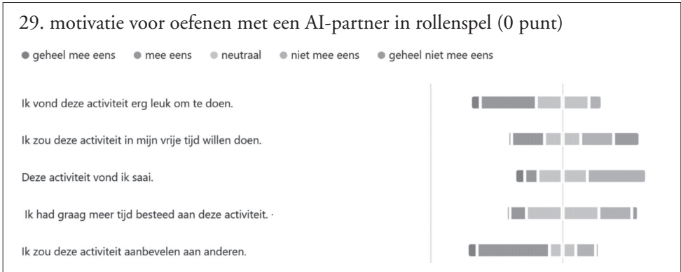
Figuur 1 – Motivatie voor het oefenen met een AI-partner.