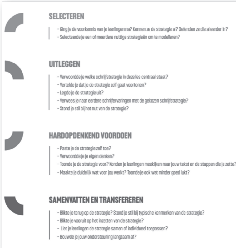
Figuur 2 – Kijkwijzer.

Dit model werd meermaals uitgetest in partnerscholen, verfijnd en omgezet in een kijkwijzer. Die kijkwijzer helpt leraren om hun eigen lessen te analyseren, om feedback te geven aan collega's of om samen lessen voor te bereiden. Bovendien creëert de kijkwijzer een gemeenschappelijke taal in het schoolteam.